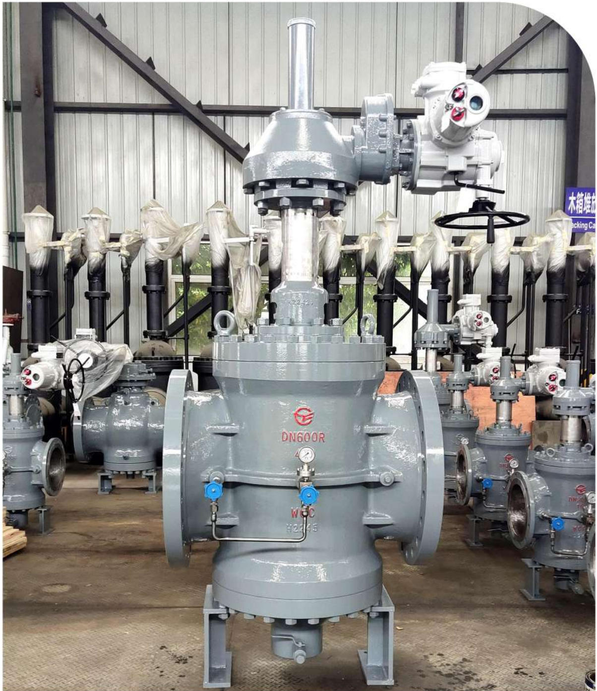
■成都乘风阀门有限责任公司精心研制开发的强制密封旋塞阀新一代产品。